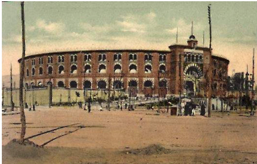
Plaza de Toros Las Arenas

2.- LA PLAZA.- Una de las primeras plazas de toros de Barcelona fue la llamada Barceloneta , que funcionó de 1824 a 1923. Después se construyó la de Las Arenas , ubicada en el centro de esa Ciudad y que tiene mas o menos veinte años de no albergar festejos taurinos en su redondel. Las Arenas se han salvado de la picota porque la afición a los toros ha podido mas