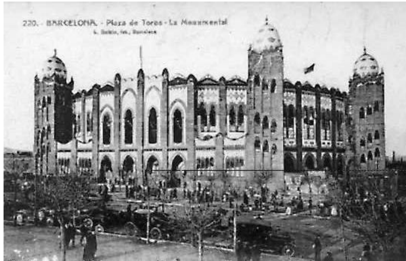
Plaza de Toros Monumental

En este punto me di cuenta de que el cartel que tenía en mis manos, era de una de las primeras corridas de la primera temporada de toros que se dio en la Monumental de Barcelona, lo que de suyo, le daba ya un valor especial.