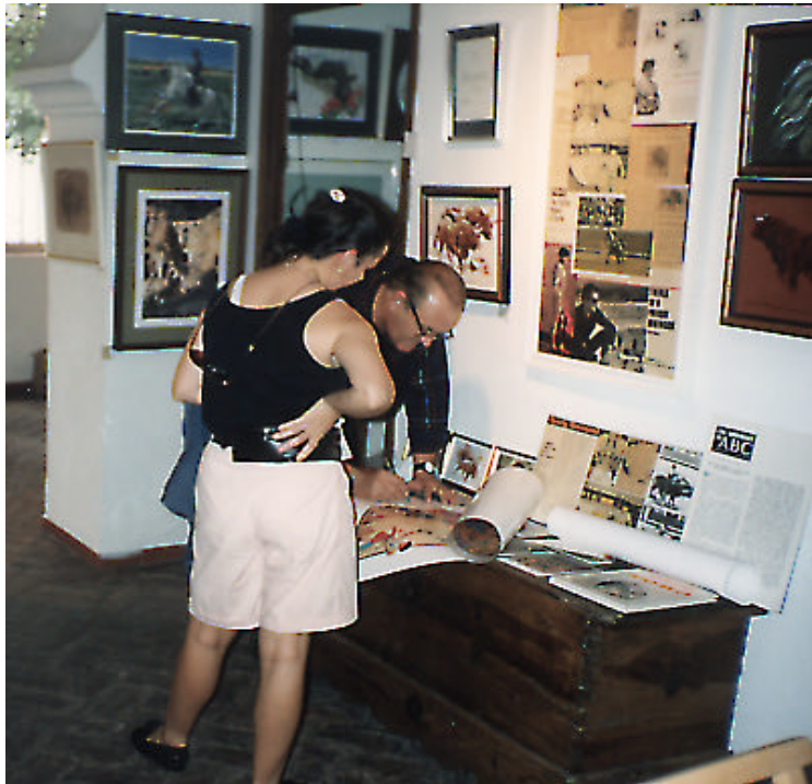
A SU ESTUDIO LLEGABAN AFICIONADOS DE TODO EL MUNDO