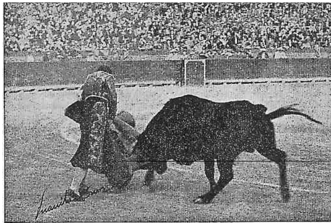
Así toreaba Juanita Cruz

Francisco Narbona en su obra De El Espartero a Jesulín. 100 efemérides taurinas nos dice sobre Juanita Cruz “Fue la primera mujer que se lanzó a torear, en 1932, acogándose a la legislación republicana, que le daba esa oportunidad al género femenino” .